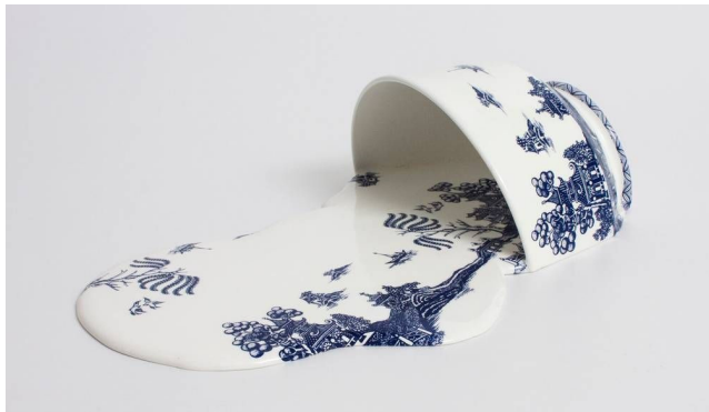
Livia Marin, Nomand Patterns , Impressão e esmalte em cerâmica e resina (2012).

A escultora chilena Livia Marin, na série Nomand Patterns (Padrões Nômades), criou um conjunto de peças a partir de fragmentos de xícaras e pratos que lembram a cerâmica inglesa vitoriana azul e branca, de inspiração chinesa. A obra retoma as cerâmicas em azul e branco do século XIX, quando eram sinal de prestígio e estavam associadas às classes aristocráticas, e mostra como em nossos dias elas foram massificadas por uma produção em larga escala.