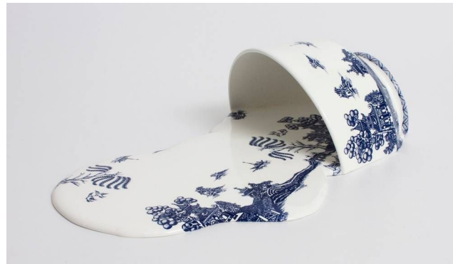
Livia Marin, Nomand Patterns , Impressão e esmalte em cerâmica e resina (2012).

A escultora chilena Livia Marin, na série Nomand Patterns (Padrões Nômades), criou um conjunto de peças a partir de fragmentos de xícaras e pratos que lembram a cerâmica inglesa vitoriana azul e branca, de inspiração chinesa. A obra retoma as cerâmicas em azul e branco do século XIX, quando eram sinal de prestígio e estavam associadas às classes aristocráticas, e mostra como em nossos dias elas foram massificadas por uma produção em larga escala.