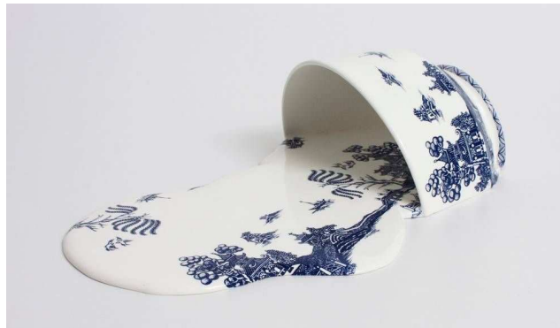
Livia Marin, Nomand Patterns , Impressão e esmalte em cerâmica e resina (2012).

A escultora chilena Livia Marin, na série Nomand Patterns (Padrões Nômades), criou um conjunto de peças a partir de fragmentos de xícaras e pratos que lembram a cerâmica inglesa vitoriana azul e branca, de inspiração chinesa. A obra retoma as cerâmicas em azul e branco do século XIX, quando eram sinal de prestígio e estavam associadas às classes aristocráticas, e mostra como em nossos dias elas foram massificadas por uma produção em larga escala.