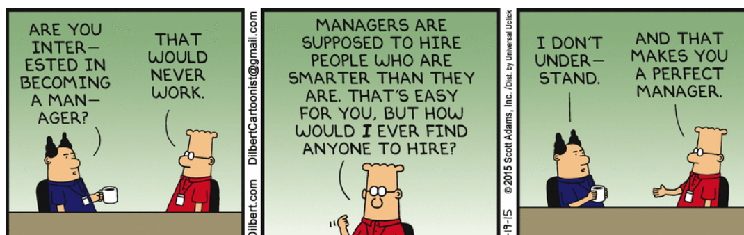
Downloaded from: https://medium.com/mydadreviews/this-dilbert-comic-strip-eb564ae7d1b9 Accessed on: December 20 th , 2021.