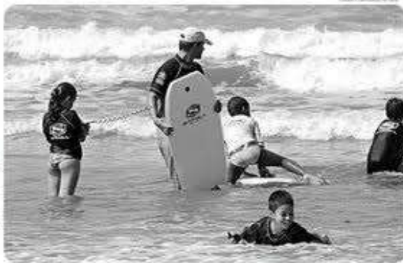
No contato com a água, alunos entre quatro e 12 anos, desenvolvem habilidades e maior autoestima.