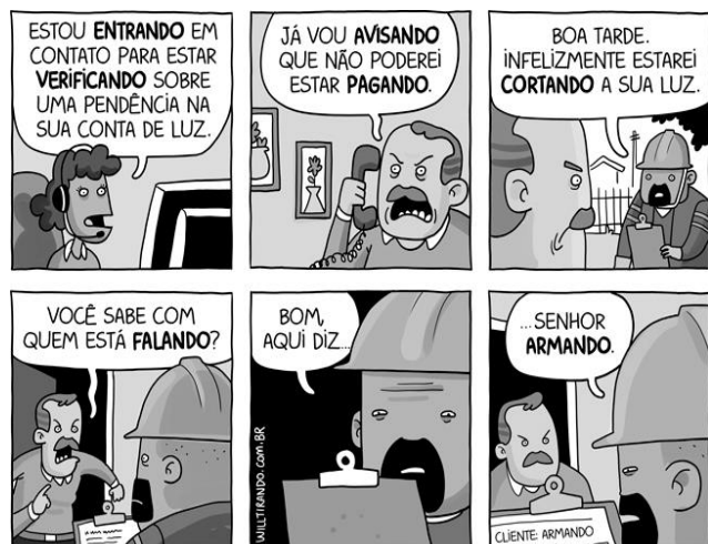
LEITE, Will. Gerúndio . Disponível em: http://www.willtirando.com.br/gerundio/ . Acesso em: 20 ago. 2022.

Dentre os itens lexicais em negrito na tirinha apresentada, um não pode ser analisado exclusivamente como verbo no gerúndio, dado o contexto em que foi utilizado. Assinale a alternativa que indica o quadrinho em que tal vocábulo aparece.