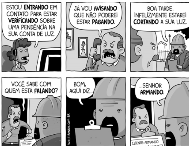
LEITE, Will. Gerúndio . Disponível em: http://www.willtirando.com.br/gerundio/ . Acesso em: 20 ago. 2022.

Dentre os itens lexicais em negrito na tirinha apresentada, um não pode ser analisado exclusivamente como verbo no gerúndio, dado o contexto em que foi utilizado. Assinale a alternativa que indica o quadrinho em que tal vocábulo aparece.