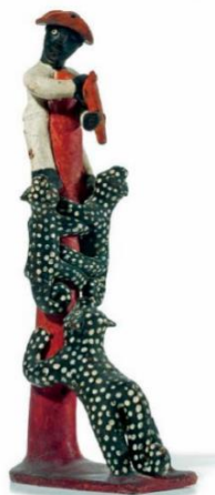
Figura 1. Mestre Vitalino. Onça atacando.

45) Mestre Vitalino foi o artesão mais célebre de Pernambuco. Suas peças de cerâmica traziam figuras inspiradas nas crenças populares, em cenas do universo rural e urbano, no cotidiano, nos rituais e no imaginário da população do sertão nordestino brasileiro.