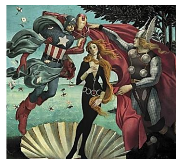
Figuras: Obras de arte