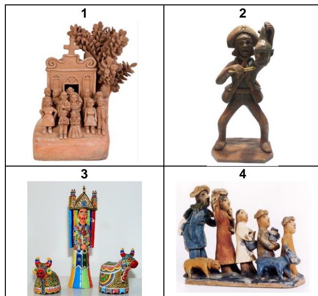
Figuras: Obras de arte popular brasileira.

43) O Brasil possui inúmeros artistas populares. Suas obras possuem a originalidade que reflete a sociedade brasileira e sua essência com qualidade estética e criativa. Os temas são os mais variados como lendas, costumes, crenças e cotidiano regional. Analise as imagens e relacione-as aos respectivos temas.