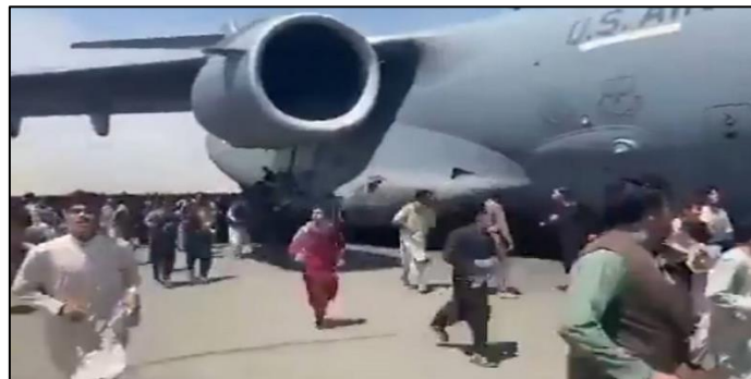
(Disponível em: uol.com.br . Acesso em: 16/08/2021.)

Sobre a situação do Afeganistão, assinale a afirmativa INCORRETA.