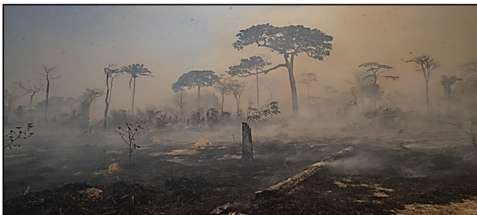
(Incêndio e desmatamento na Amazônia. Região Norte do Brasil. — Foto: André Penner/AP. Disponível em: https://g1.globo.com/natureza/amazonia/noticia/2021/08/19/. )

Sobre o desmatamento na Amazônia nos últimos anos, analise a imagem e as afirmativas.