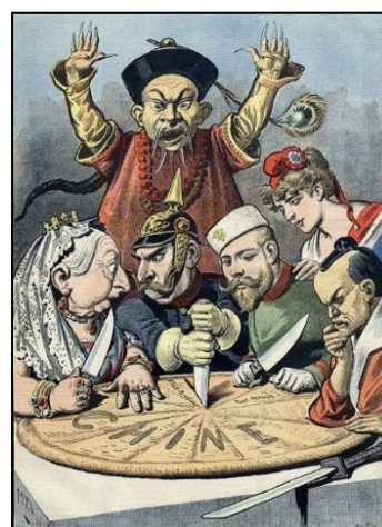
(A Torta Chinesa. Henri Meyer. Publicada em 16/01/1898 no Le Petit Journal; França.)

Considerando a charge e conhecimentos sobre atualidade, é correto afirmar que a China: