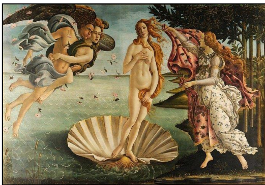
(O Nascimento de Vênus. Obra de Sandro Botticelli.)

Considerando as imagens anteriores, assinale a afirmativa correta.