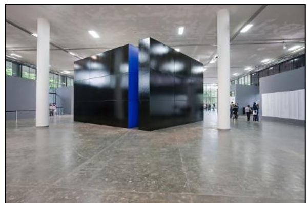
(Vista da parte externa da obra Inferninho, de Luiz Zerbini, 2010.)

A instalação Inferninho do artista paulistano Luiz Zerbini (1959) foi apresentada na 29ª Bienal de Arte de São Paulo; era uma caixa preta, que, ao entrar, o público, se deparava com cores, luzes, texturas, interagindo com formas e com a possibilidade de criar naquele espaço. Assinale a afirmativa que está relacionada à obra de Luiz Zerbini.