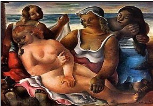
(Nascimento de Vênus, 1940, Di Cavalcanti.)

O quadro “Nascimento de Vênus”, pintado pelo pintor brasileiro Di Cavalcanti, no ano de 1940, é uma releitura da obra “O Nascimento de Vênus”, do pintor italiano Sandro Botticelli.