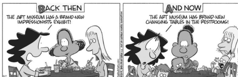
Baby Blues by Rick Kirkman and Jerry Scott