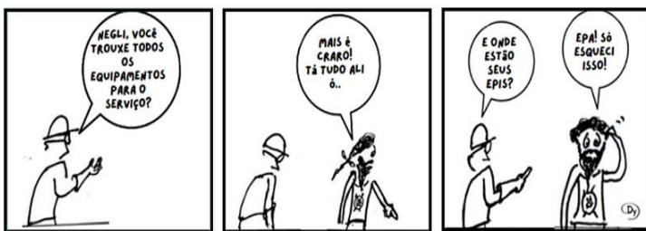
(Disponível em: https://temseguranca.com/category/quadrinhos/ .)

Considera-se Equipamento de Proteção Individual (EPI) todo dispositivo ou produto, de uso individual utilizado pelo trabalhador, destinado à proteção de riscos suscetíveis de ameaçar a segurança e a saúde no trabalho. De acordo com a tirinha, pode-se afirmar que: