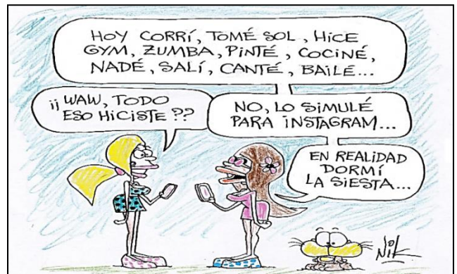
(Disponible en: https://twitter.com/nikgaturro/status/1085390034709164033 . Acceso en: 24/06/2022.)

Haga la lectura de la tiritra para contestar las cuestiones 31 y 32 .