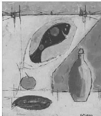
Natureza-Morta [Peixe e Garrafa] Estrigas