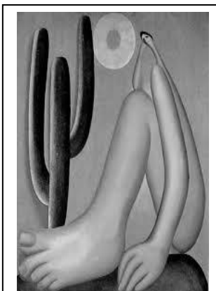
Abaporu – Tarsila do Amaral