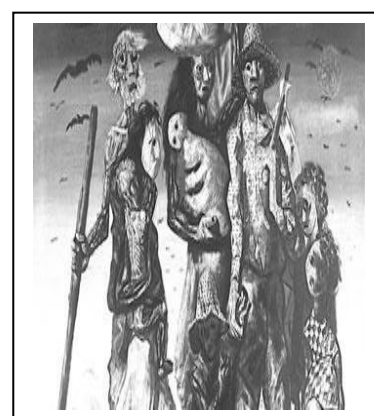
Os Retirantes – Cândido Portinari