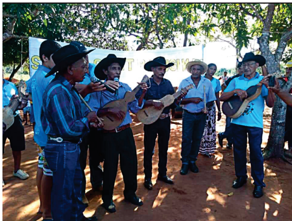
Tradições Bugrenses.