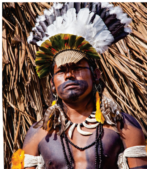
Índigena Umutina.