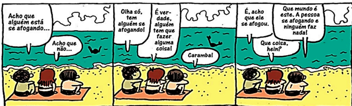
(Dilema. Disponível em: http://proedu.rnp.br/bitstream/ . Acesso em: 16/04/2023.)