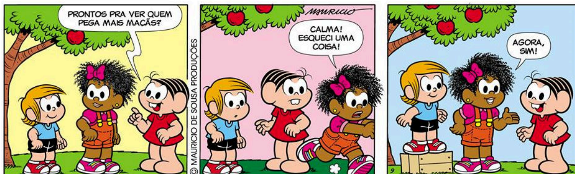
(Igualdade. Disponível em: http://caroldiversidade.blogspot.com/2019/01/3-postagem-construindo-novas-historias.html . Acesso em: 16/04/2023.)