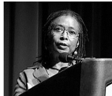
Alice Walker (born February 9, 1944), an American novelist, short story writer, poet, and social activist ( https://en.wikipedia.org/wiki/Alice_Walker )