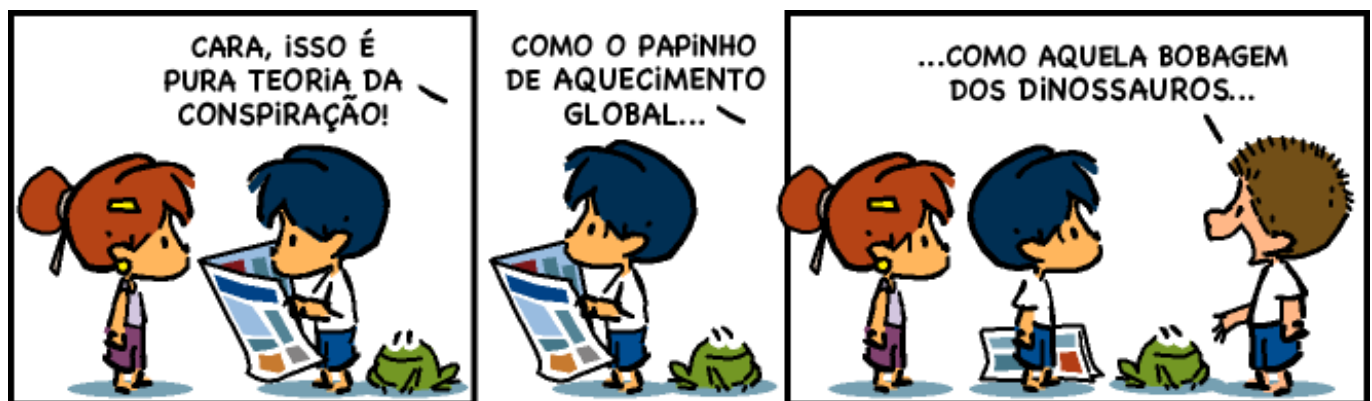
Figura 1 (Fonte: Tiras Armandinho).

QUESTÃO 37 – Analise a Figura 1 abaixo, que apresenta uma tirinha de Armandinho.