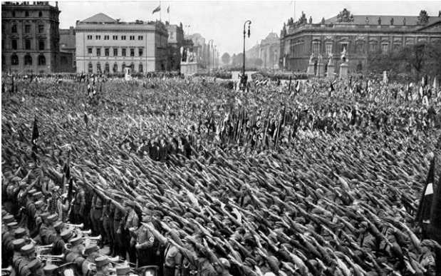
Cena de Triunfo da Vontade. Riefenstahl, L. (1935).

O fotograma a seguir é do documentário “Triunfo da Vontade” da cineasta Leni Riefenstahl, utilizado como instrumento de propaganda pelo regime nazista.