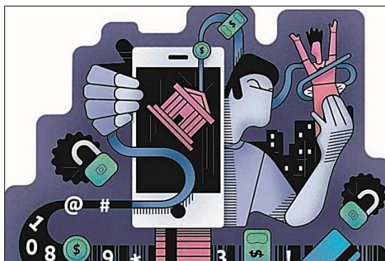
(Saiba o que fazer em casos de vazamento de dados pessoais - Ilustração Luciano Veronezi.)

Produza uma dissertação, com base nos textos motivadores, tendo como tema: