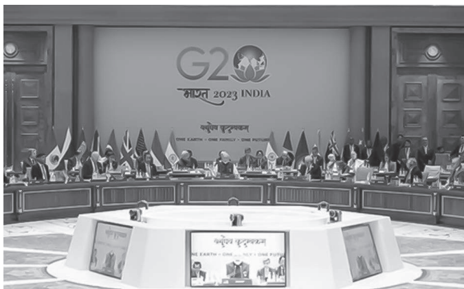
Reunião do G20 em Nova Délhi, Índia, 2023.

A respeito da reunião do G20, referenciada na imagem, julgue os itens de 56 a 63 .