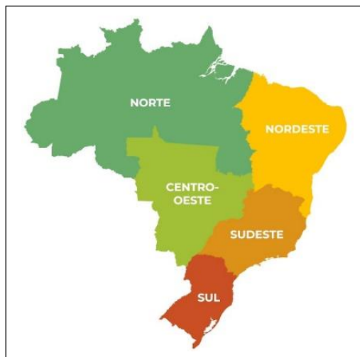
Mapa das Regiões Brasileiras

O Sudeste é composto por quatro Estados; assinale-os.