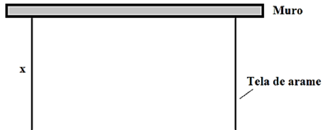
Projeto da área a ser cercada vista de cima.

Um administrador planeja construir uma cerca retangular para limitar uma área nas dependências do hospital onde trabalha. Para tanto, conforme a figura, deve aproveitar parte de um muro, já existente na área a ser limitada, como um dos lados da cerca, e 120 metros de tela de arame, que sobraram de construções anteriores e deverão ser totalmente gastos nos outros três lados da mesma cerca.