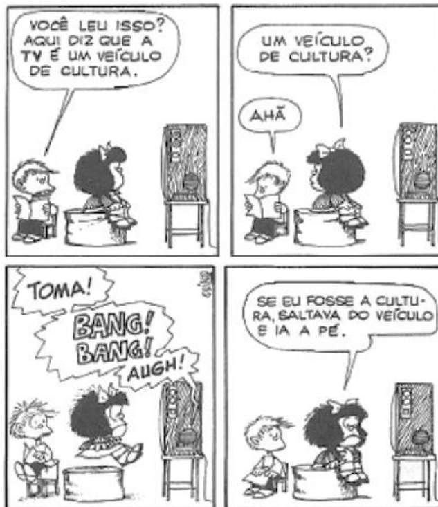
QUINO. Mafalda . São Paulo: Martins Fontes, 2002.