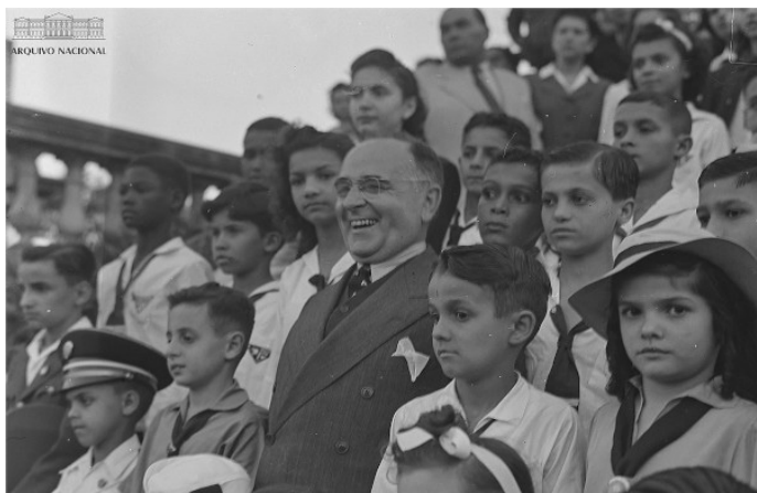
Vargas e crianças na Quinta da Boa Vista nas comemorações da Semana da Pátria, setembro de 1943.

Essa imagem, do auge da Ditadura do Estado Novo (1937 – 1945), demonstra uma das características do estilo Vargas de governar, marcado por: