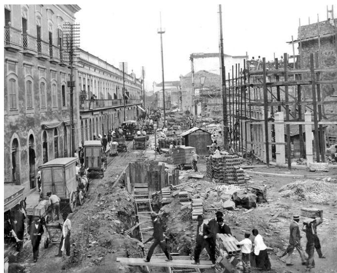
Rua da Carioca em obras – Augusto Malta, 31/01/1906 – AGCR

Barreto apud Leitão Junior; Anselmo, 2011, p. 448.