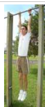
Posição Final (3)