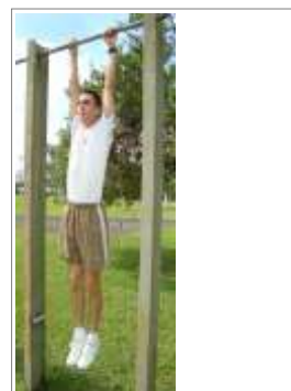
Posição Inicial (1)

A posição de pegada é pronada, (palmas das mãos voltadas para a frente) e correspondente a distância lateral biacromial (dos ombros), braços e pernas estendidas, com o corpo na posição vertical, perdendo contato com o solo(1);