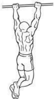
Figura 2 – Posição inicial 01 e, posição final 03.

b.2 Número de repetições: conforme tabela “Anexo V”.