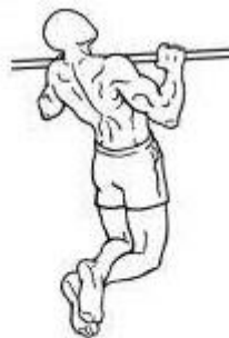
Figura 3 – Posição 02 intermediária.