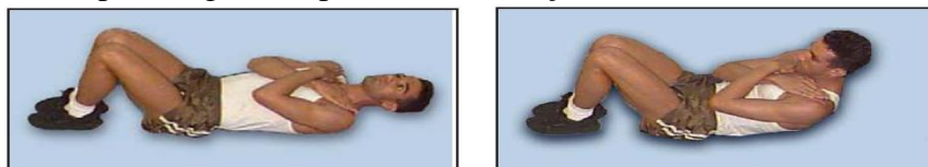
Figura 1: execução do abdominal

9.16.4 No endereço eletrônico da 12ª Região Militar encontra-se vídeo apresentando a correta execução do abdominal supra, exigido no processo de seleção.