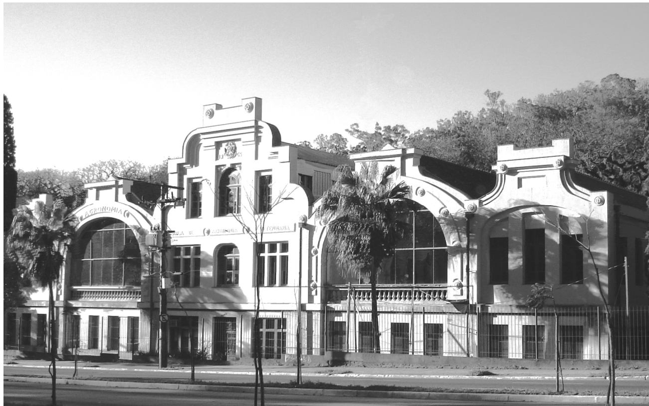
Prédio da Faculdade de Agronomia

Colabore com a Restauração dos Prédios Históricos da UFRGS. Com a ajuda dos alunos, professores, técnico-administrativos e comunidade em geral, já conseguimos restaurar 7 dos 12 prédios que fazem parte da história do nosso Estado. O valor doado poderá ser inteiramente deduzido do Imposto de Renda, desde que não exceda 6% do Imposto Devido para Pessoas Físicas.