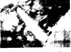
Cachoeira das Moendas