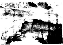
Gruta da Mangabeira