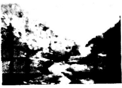
Rio Mato Grosso