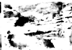
Bica da Água Preta