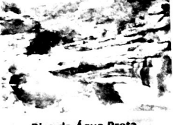
Bica da Água Preta