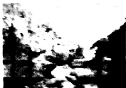
Rio Mato Grosso