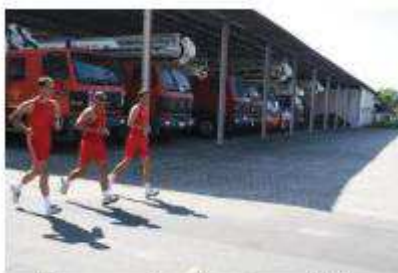
Execução do exercício

9.3.1. Corrida de 12 minutos: consiste num exercício para o qual o candidato efetuará um deslocamento contínuo, podendo andar ou correr, onde a distância percorrida será convertida em pontos de acordo com as tabelas I e II.