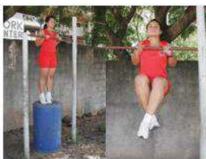
Posição inicial Execução do exercício

9.3.3. Barra estática (feminino): consiste na permanência em pegada de pronação (palmas das mãos voltadas para frente, dorsos das mãos voltados para o rosto), com o queixo ultrapassando a linha da barra, pelo maior tempo possível, em isometria, sem o auxílio de qualquer outro meio de sustentação que não sejam as mãos. Somente a partir da tomada de posição, com os braços flexionados e o queixo acima da linha superior da barra, com a cabeça na posição normal (olhando para frente) é que o cronômetro será acionado. Durante a execução, a candidata deverá manter o corpo retesado, como se houvesse uma linha reta partindo do calcanhar até o ombro e permanecer até o final do tempo exigido, para só depois retirar-se da barra, não sendo permitido balanceio, flexão dos joelhos, cruzamento das pernas, tocar o pé no solo ou qualquer parte do suporte do aparelho da barra fixa após o início do teste, não podendo apoiar o queixo na barra e nem utilizar luva(as) ou qualquer outro material para proteção das mãos, caso contrário será eliminada. O tempo de permanência será convertido em pontos conforme tabela II.