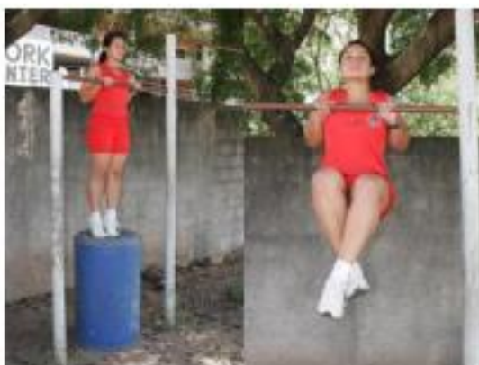
Posição inicial Execução do exercício

9.3.3. Barra estática (feminino): consiste na permanência em pegada de pronação (palmas das mãos voltadas para frente, dorsos das mãos voltados para o rosto), com o queixo ultrapassando a linha da barra, pelo maior tempo possível, em isometria, sem o auxílio de qualquer outro meio de sustentação que não sejam as mãos. Somente a partir da tomada de posição, com os braços flexionados e o queixo acima da linha superior da barra, com a cabeça na posição normal (olhando para frente) é que o cronômetro será acionado. Durante a execução, a candidata deverá manter o corpo retesado, como se houvesse uma linha reta partindo do calcanhar até o ombro e permanecer até o final do tempo exigido, para só depois retirar-se da barra, não sendo permitido balanceio, cruzamento das pernas, tocar o pé no solo ou qualquer parte do suporte do aparelho da barra fixa após o início do teste, não podendo apoiar o queixo na barra e nem utilizar luva(as) ou qualquer outro material para proteção das mãos, caso contrário será eliminada. O tempo de permanência será convertido em pontos conforme tabela II.