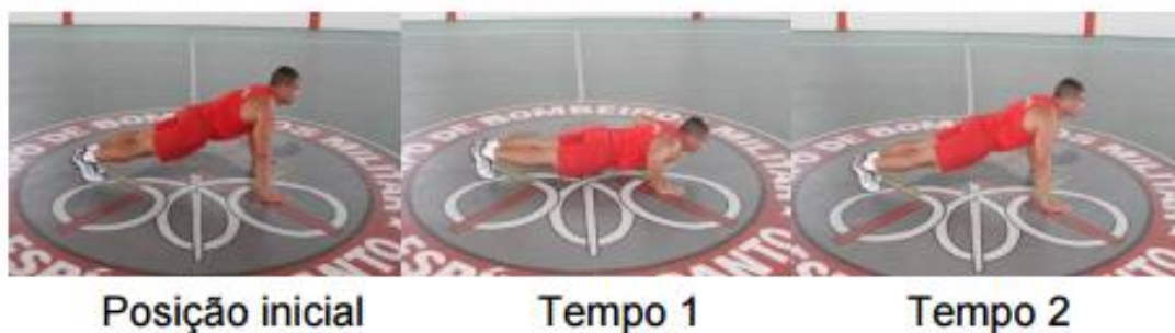
TABELA DE PONTUAÇÃO APOIO DE FRENTE SOBRE O SOLO REMADOR EM 1MINUTO Idade de 18 até 40 anos

9.3.5.2. Apoio de frente sobre o solo masculino: serão executados durante 1 minuto em 04 pontos de contato com o solo e de forma ininterrupta. Cada repetição consistirá em dois tempos. O 1º será a flexão do cotovelo até que o braço e antebraço formem um ângulo mínimo de 90º e o 2º tempo será a extensão completa dos membros superiores. Durante a execução, o candidato não poderá sair da posição necessária para a execução do exercício, caso contrário, será eliminado. O total de repetições será convertido em pontos de acordo com a tabela I.