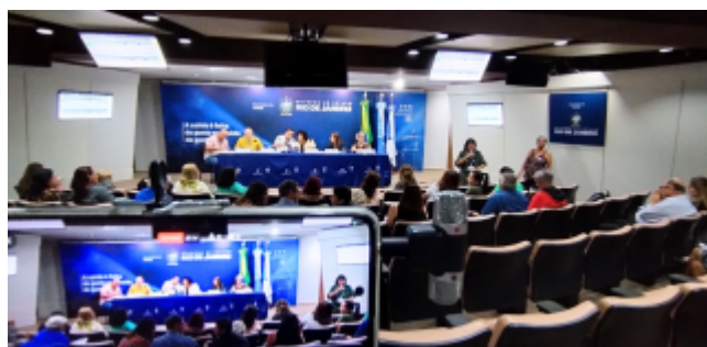
Plenário do CES/RJ.