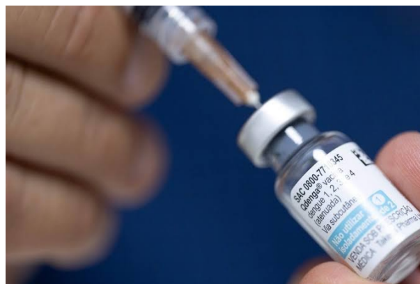
Lançamento estadual da Campanha de Vacinação contra a Dengue ocorrerá em Aparecida de Goiânia