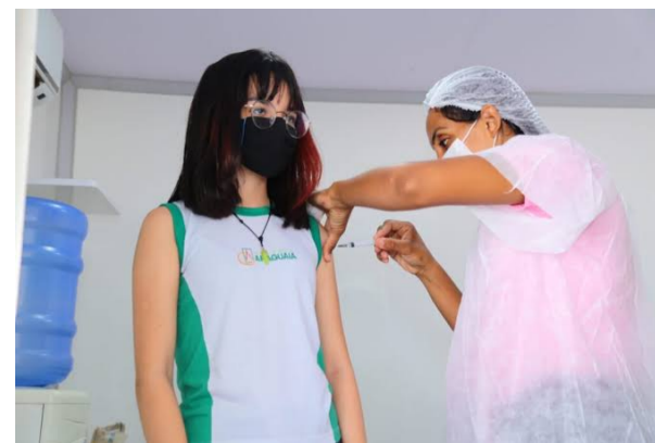
Prefeitura de Aparecida inicia vacinação contra a dengue em crianças a partir da próxima quinta, 15 de fevereiro