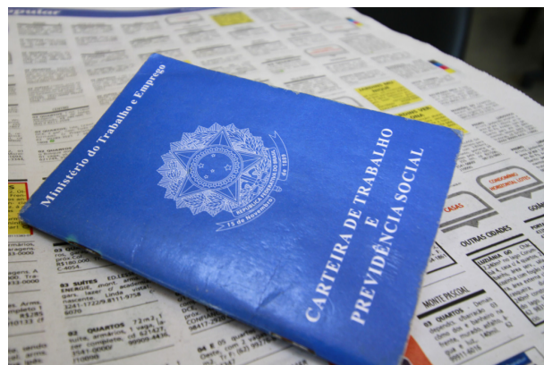
SIME Aparecida oferece mais de 260 vagas de emprego nesta semana