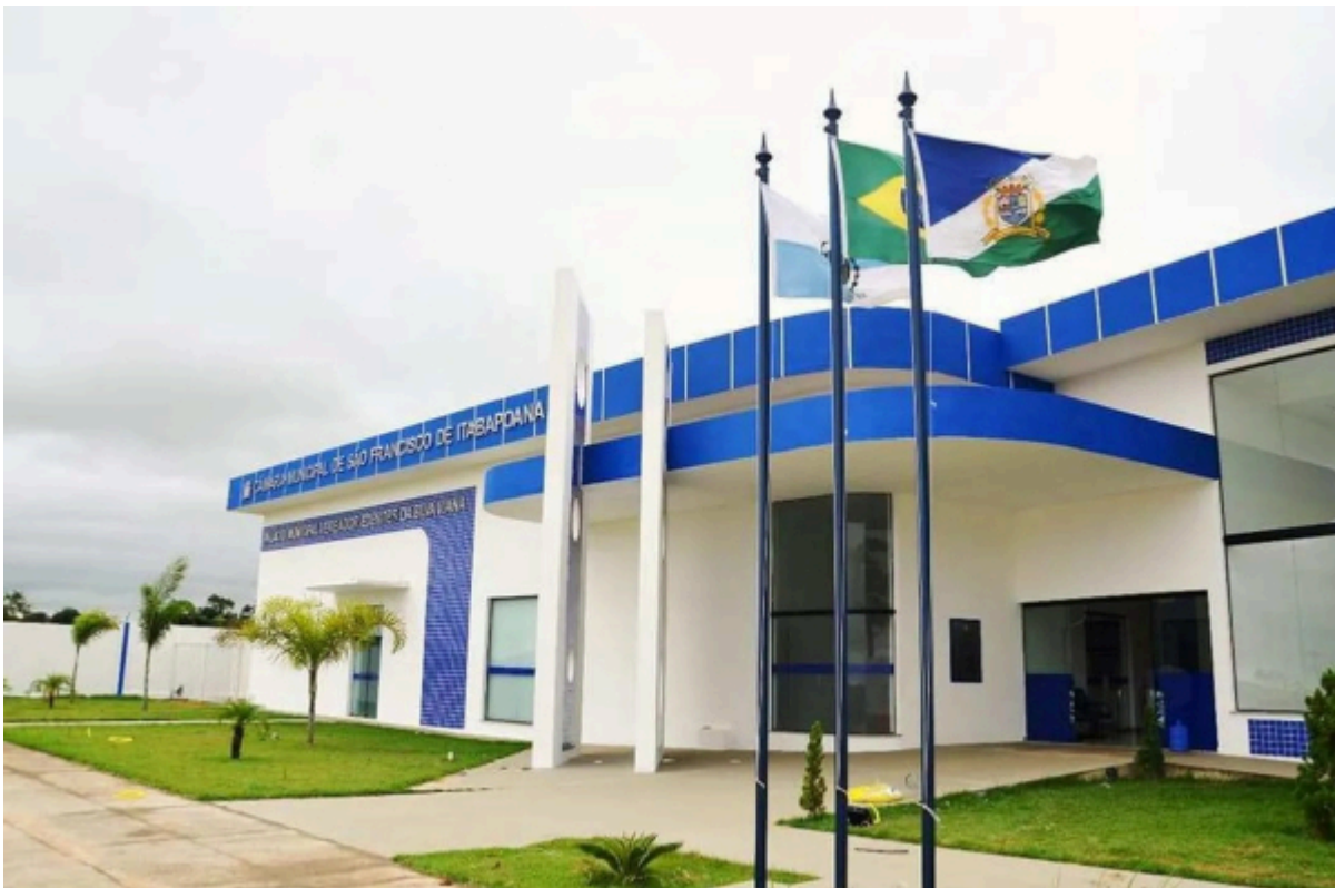
( /media/k2/items/cache/c0bc8bf44cc3916479c94fd5e351f4bd_XL.jpg )