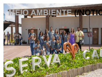
MEIO AMBIENTE (/NOTICIAS/ITEMLIST/CATEGORY/9-MEIOAMBIENTE)