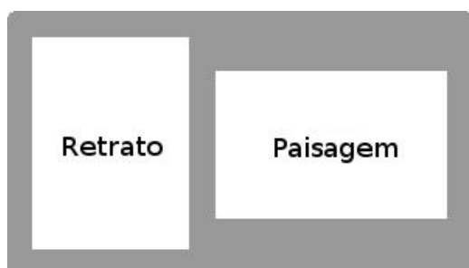
Forma correta de digitalização dos documentos

11.5.1. O candidato deverá digitalizar os documentos no formato RETRATO (vertical) ou PAISAGEM (horizontal), com as informações disponíveis para os avaliadores sem necessidade do uso do recurso de “girar visualização”, conforme imagens a seguir: